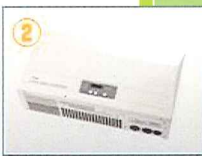
パワーコンディショナ