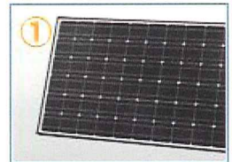
太陽電池モジュール